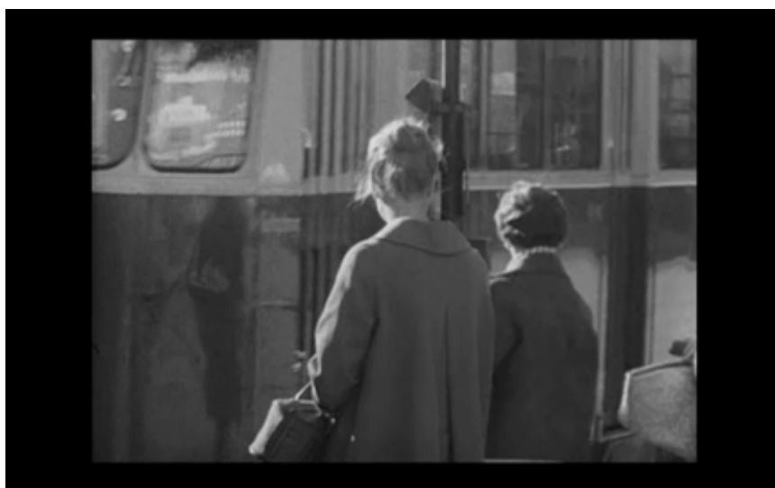
44. Folk väntar på bussen (bussen kommer)