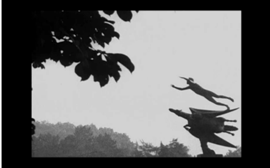
18. Skulpturen Pegasus i Slottsparken (helbild)