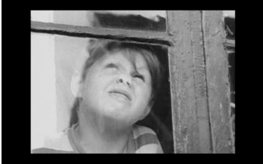
20B. Pojken trycker näsan mot fönsterrutan