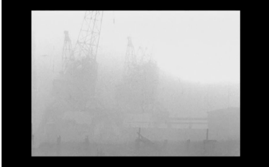
15. Kranar i dimma