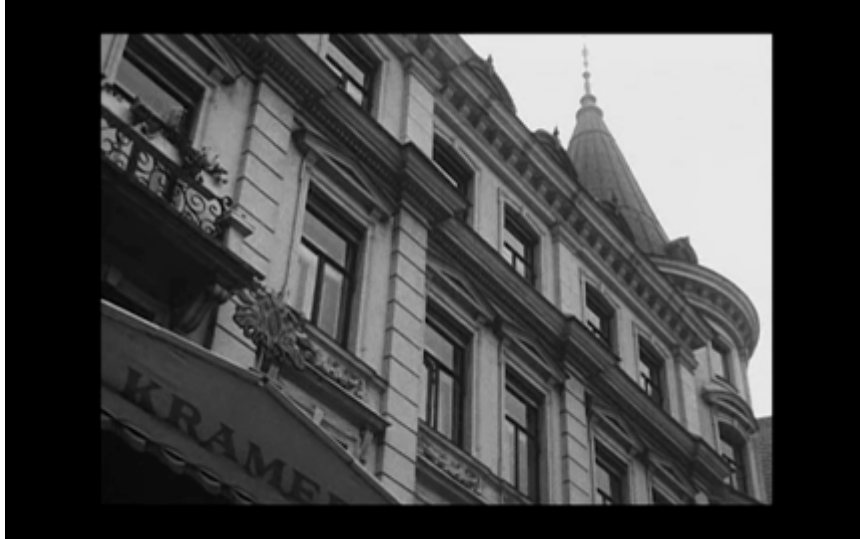
9. Hotell Kramer (fasaden ur grodperspektiv)