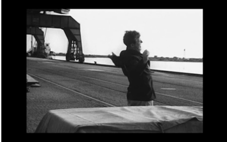
22. En uteliggare vaknar