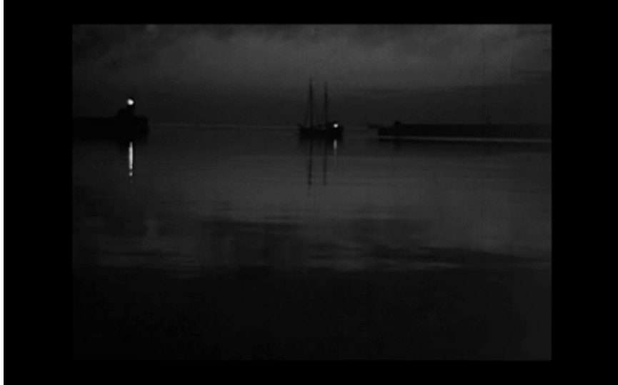
4. Båt i hamnen