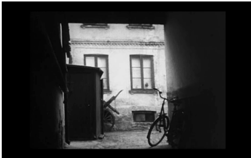
10. Passage med cykel