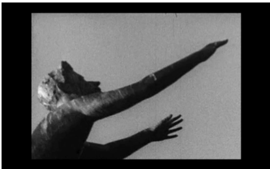
17. Skulpturen Pegasus i Slottsparken (närbild)