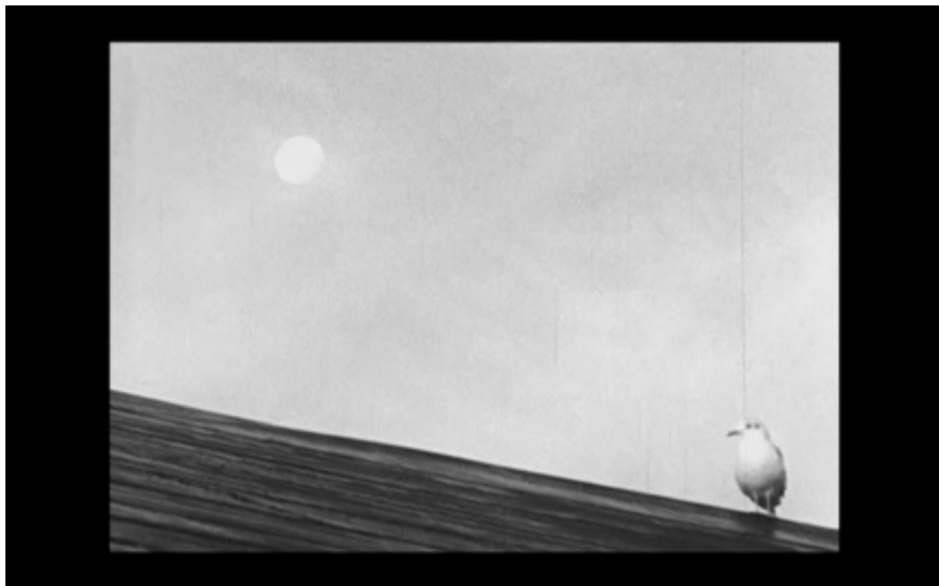
21A. En fågel som pojken ser