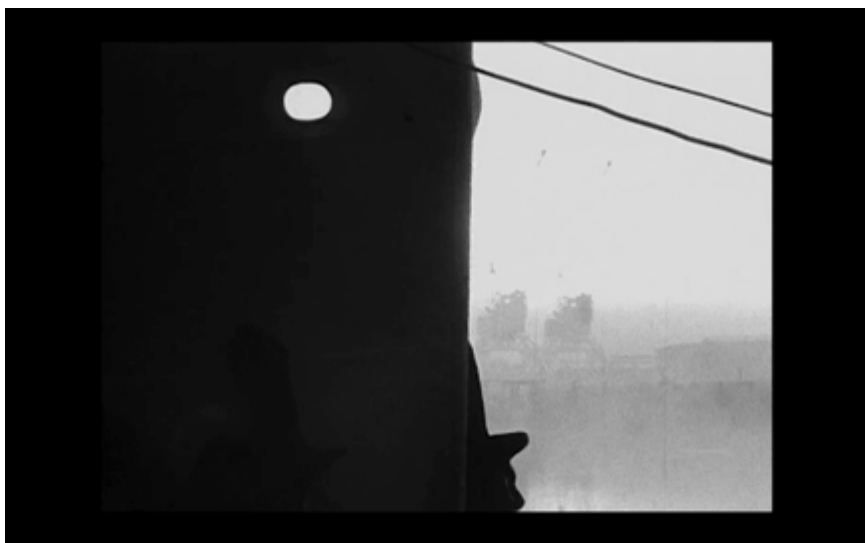
14. Båt med linor