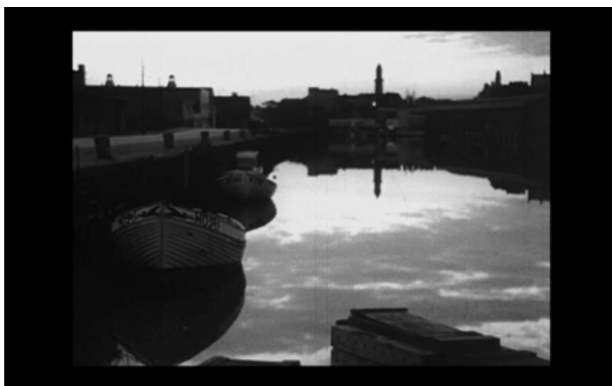
11. Båtar i hamnen