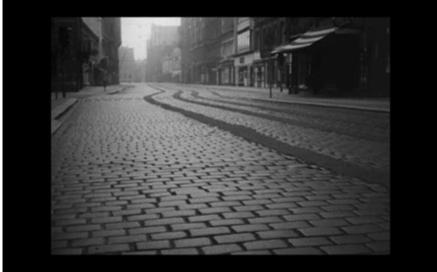
6. Gata med gatsten