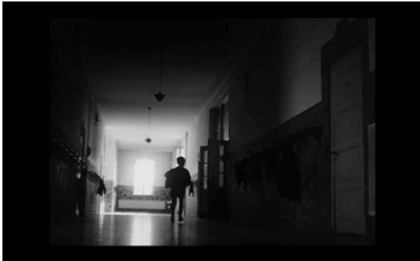
49. Pojken i skolkorridoren