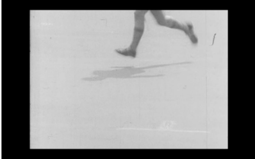
47. Pojken springer