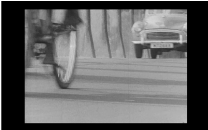
38B. Cyklar och bilar (grodperspektiv)