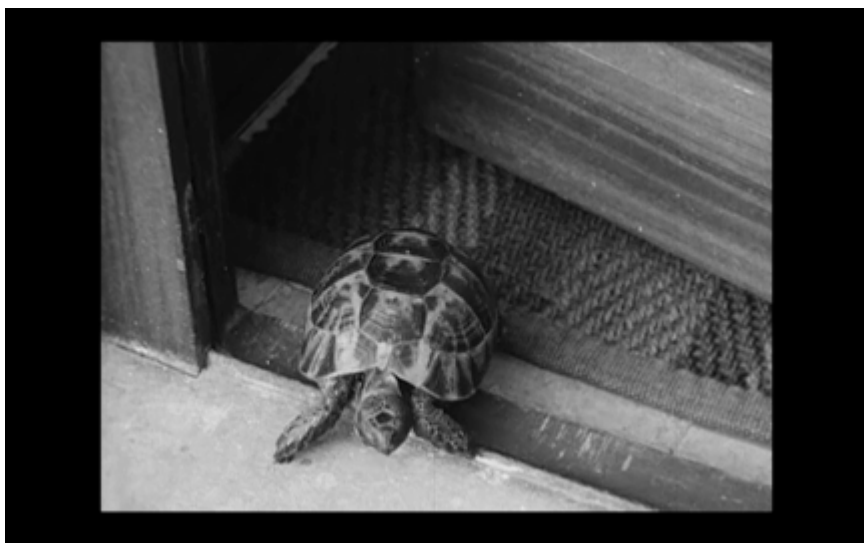
24. Sköldpaddan på tröskeln