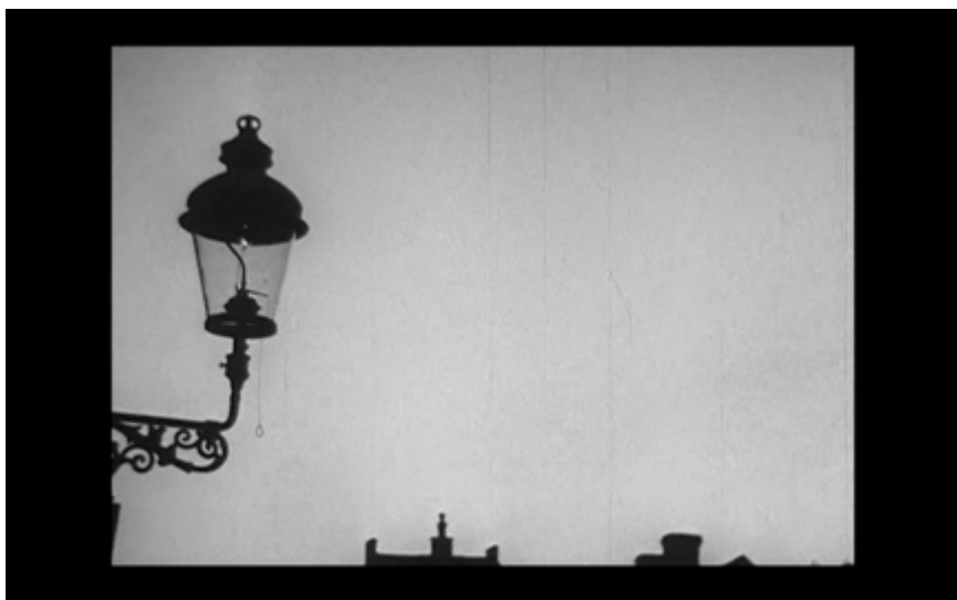
5B. Gatubelysningen släcks