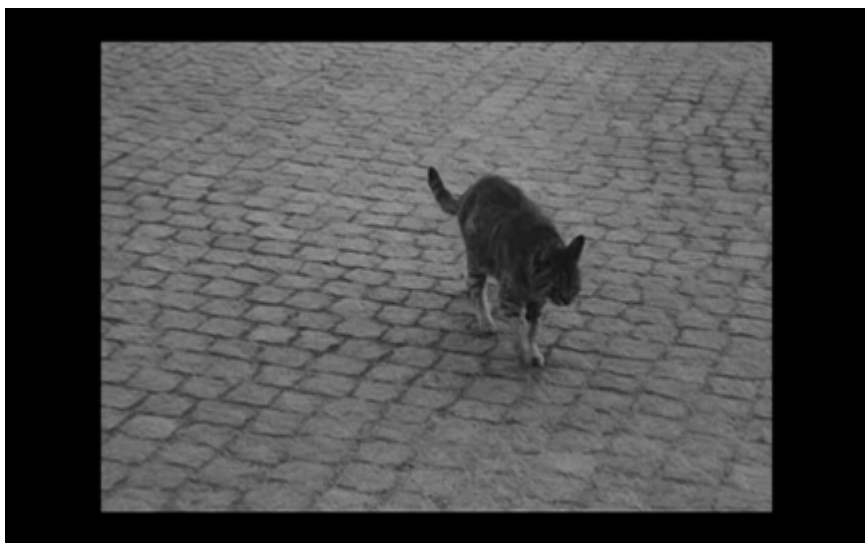
8. Katt på gatan