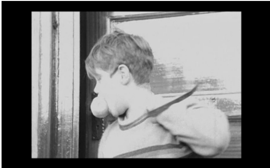
23. Pojken går ut genom dörren och har ett äpple i munnen