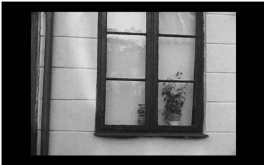
19. Fönster med rullgardin