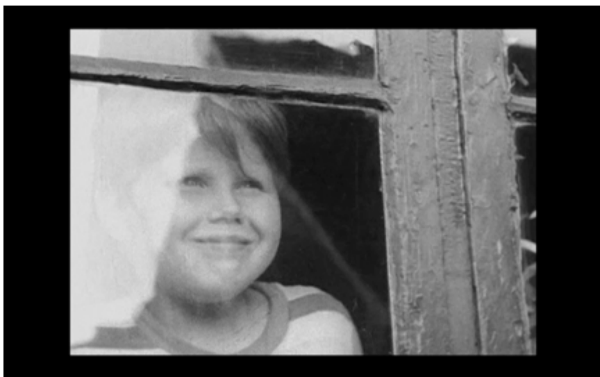
20A. Rullgardinen dras upp. En pojke tittar ut genom fönstret