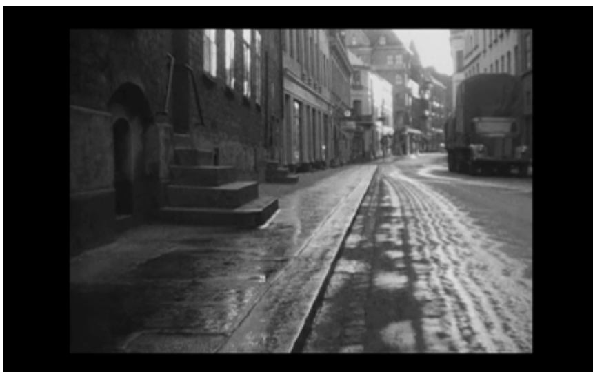
27. Gata och trafik