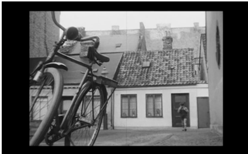
26. Pojken går hemifrån