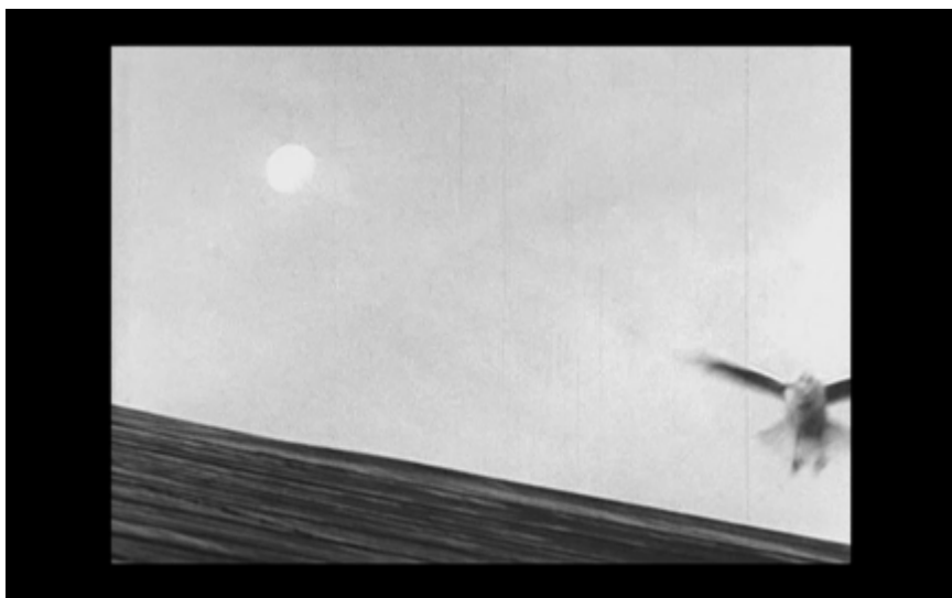
21B. Fågeln flyger iväg