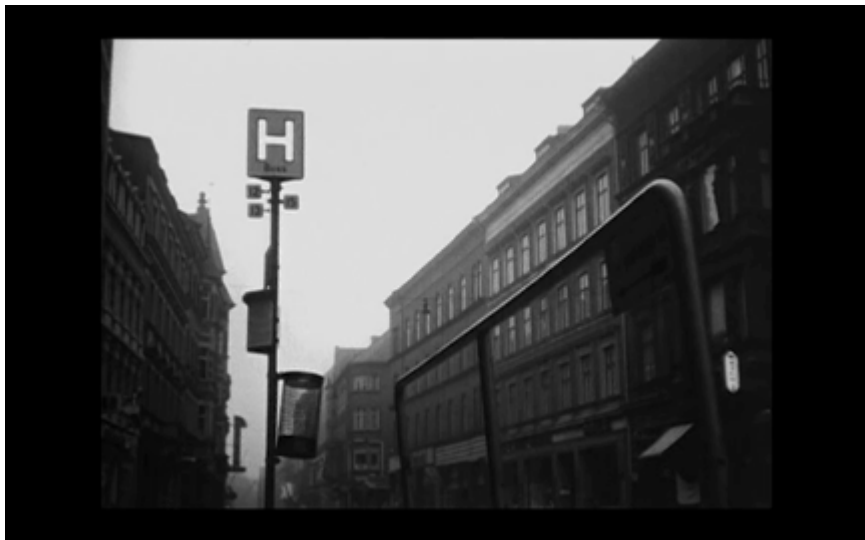
7. Busshållplats med stolpe och tidtabell