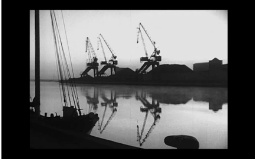
12. Kranar i hamnen