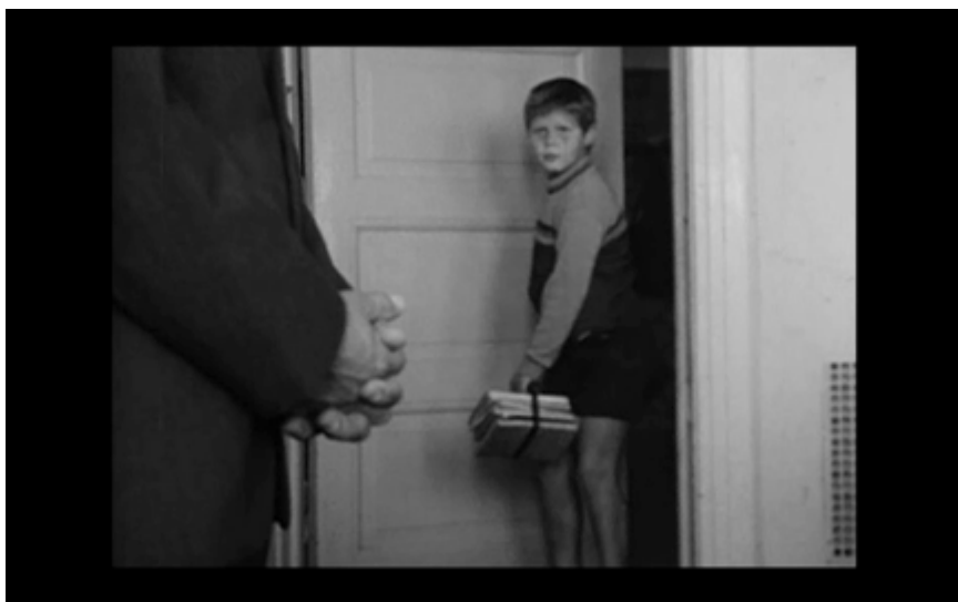
51. Pojken gör entré i klassrummet