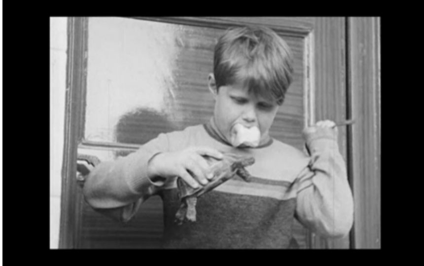
25. Pojken tar upp sköldpaddan