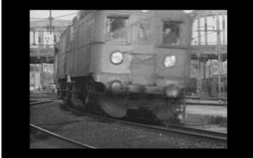
36. Ett tåg i full fart